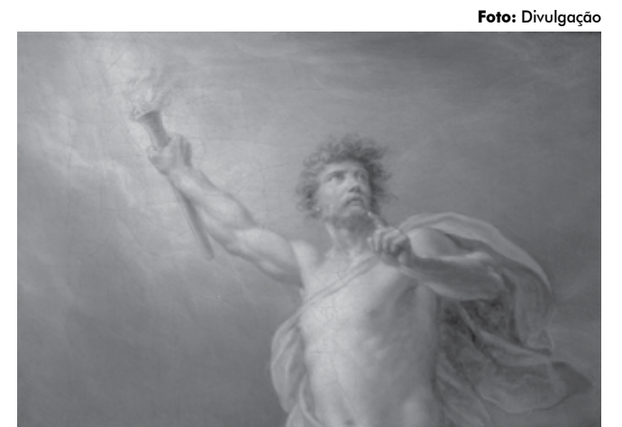
Na mitologia grega, Prometeu roubou o fogo dos deuses para dar aos mortais

Gratificante e necessário é perceber o valor da mitologia grega, que, após milênios, mantém-se fonte inexaurível, tal como a “água que mata a sede para sempre”, fundamental para o sábio burilamento de nossas consciências.