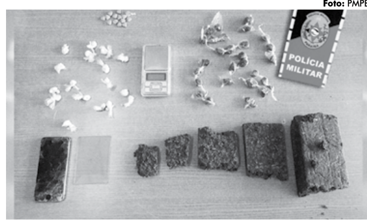
Foram apreendidos cocaína, maconha e comprimidos de ecstasy em João Pessoa

A Polícia Militar apreendeu também duas armas de fogo, na noite dessa terça-feira, na cidade de Bayeux, em