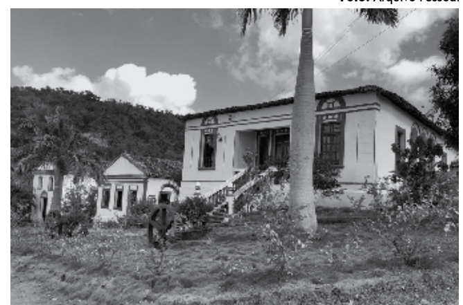
Em Serraria (PB) se encontra o engenho Martiniano, com arquitetura do séc. 19