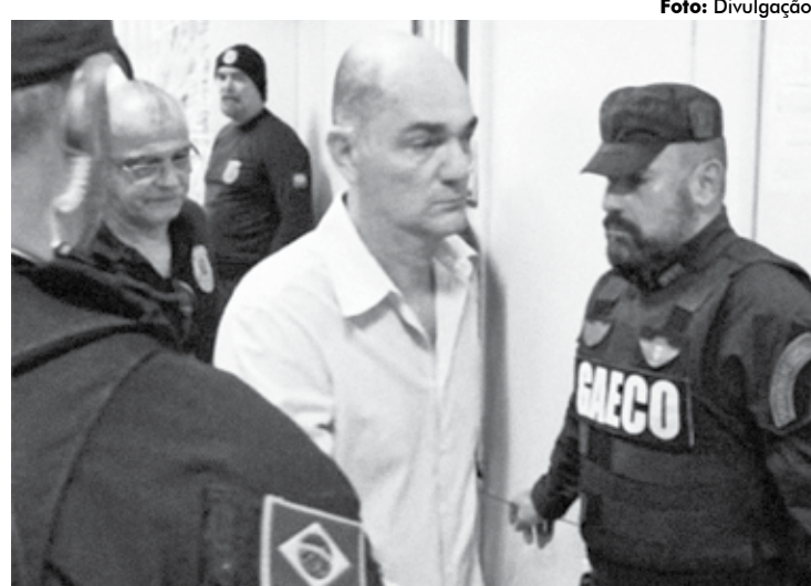
Coriolano estava descumprindo medidas cautelares impostas pela Justiça

A prisão preventiva foi em cumprimento a mandado expedido pela Justiça paraibano. A décima fase da Opera-