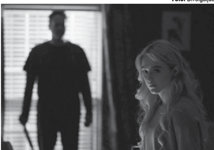
'Freaky' mostra uma jovem que troca de corpo com um temido assassino serial

Dirigido por Christopher Landon, justamente o mesmo realizador dos dois filmes de A Morte Te Dá Parabéns , o longa está em cartaz nos cinemas de João Pessoa (Cinépolis do Manaíra e Mangabeira Shopping, CineSercla do Tambiá) e Campina Grande (CineSercla do Partage), que estão adotando medidas de biossegurança por conta da pandemia.