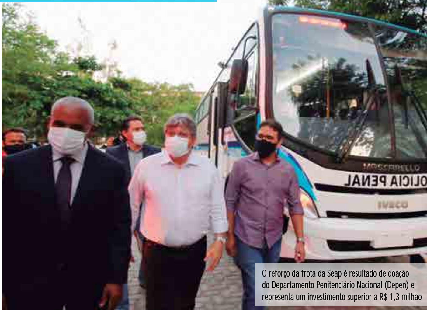
O reforço da frota da Seap é resultado de doação do Departamento Penitenciário Nacional (Depen) e representa um investimento superior a R$ 1,3 milhão