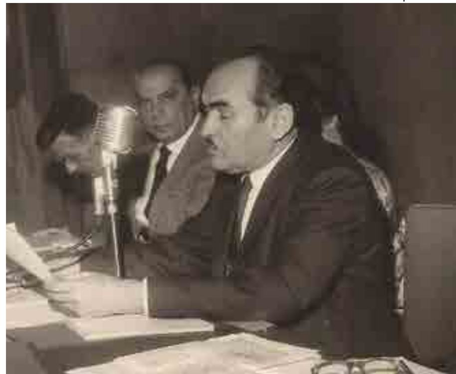
Regente será o primeiro homenageado pela iniciativa que reconhece artistas vítimas de perseguições da ditadura